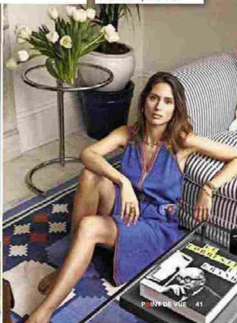
P. INT. DE VUE 41